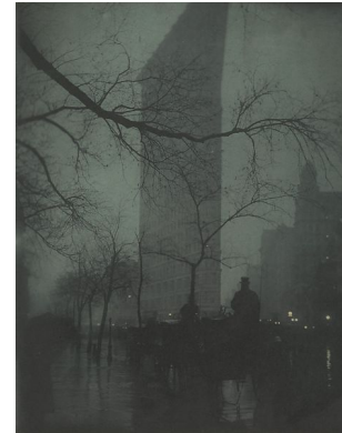
Edward Steichen, Flatiron, 1904

Pictorialisme : Le pictorialisme est un mouvement qui rapproche la photographie de la peinture et du dessin afin que celle-ci soit également reconnue en tant qu'Art. Les artistes de ce mouvement privilégient le flou et cherche souvent à imiter les peintres impressionnistes. Ils recourent également à la retouche photographique.